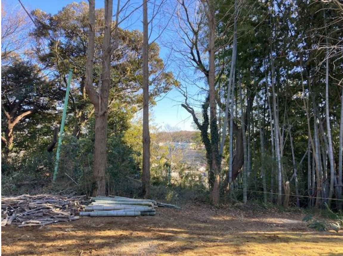
【東棟昇降口から東金街道方面の風景】