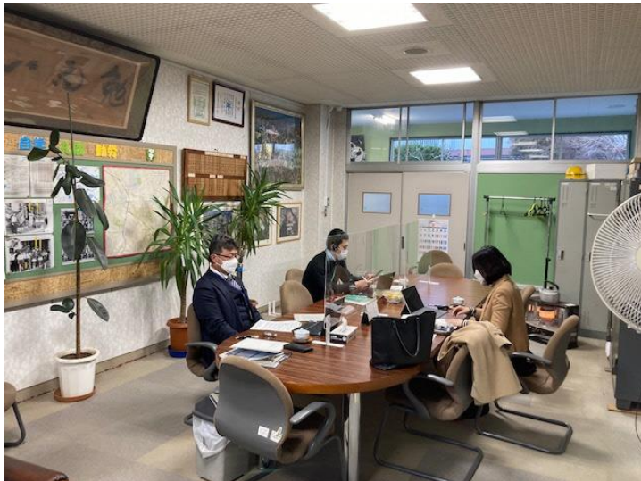
【校長室からオンラインでフォーラムに参加している様子】