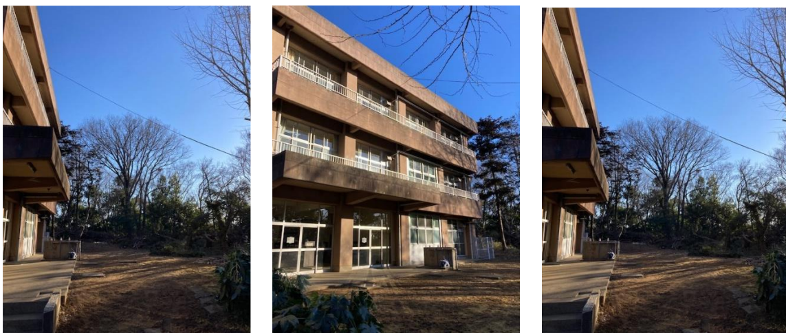
【朝日が当たる東棟の昇降口回りの様子 7:40頃】

東棟昇降口の周りの南東側の斜面の樹木が育ち、東棟の室内の明るさに影響を及ぼしておりました。本校の用務員が伐採し校舎の前の見開きがよくなりました。今後、校舎前に畑等を作る予定です。