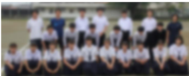
【3年生体育祭実行委員のみなさん】