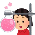
自然科学部部长 2年E組 Uさん

私はこれから部長として皆をまとめ、今まで通り楽しく話したり、活動したりする部活動にしたいです。活動内容は少しずつ増やしていき、実験や畑仕事などを行える範囲で案を出し合い、実行していききたいと思います。