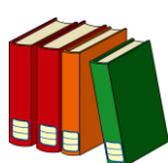
図書部部长 2年E組 Cさん

私は部長として、周りの人の役に立ちたいです。いつも優しく、時に厳しく指導してくださった前部長を見習い、部員のみんなに頼られるような存在になることを目標に、未熟ながらも日々成長していききたいです。