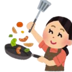
家庭科部部长 2年B組 Tさん

私はリーダーの立場に立ったことがなく、不慣れなことも多いですが、なったからには全力でやり切ります。活動後の掃除の意識や月に一度の調理実習をスムーズに行えるようにするなどを頑張っていきたいと思います。