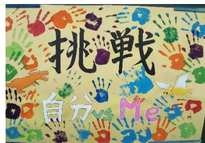
3年2組 学級目標揭示物