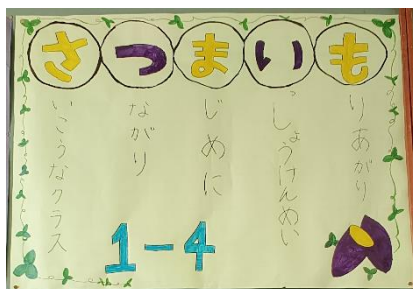
1年4組 学級目標揭示物