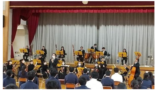
演奏間にそれぞれの楽器の説明をしています

いま流行っている鬼滅の刃の「紅蓮華」が演奏されたときには、テンポの良い曲調に体を動かしながら聞いている姿もありました。