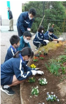
苗を花壇に植え替え中

まちづくり事業の一環で、花の苗（ビオラ）が約30鉢届きました。早速、東門側の植え込みに苗用ポットから植え替え作業をしました。今の時期は、桜の葉が木枯らしに吹かれ一斉に落ち、枝ばかりになっています。モノトーンをイメージする冬の寒空の下、ビオラが正門を彩っています。