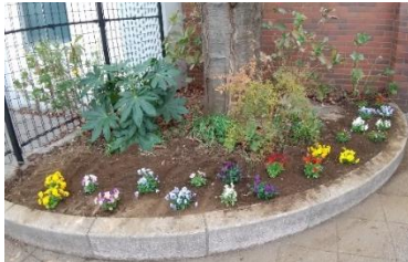
植え替え後の東門脇の花壇

また、毎日掃いても掃いても次から次へとイチョウの葉が大量に地面を覆い、黄色く色付けています。学校の周りの歩道の落ち葉掃きも、毎日行っても追いつかないほどです。