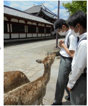
鹿にえさをねだられている生徒

3年生にとっては中学生で初の宿泊行事が修学旅行でした。古都、京都・奈良の仏像や建造物などについて事前学習していた知識を生かし、現地での見聞を深めてきました。