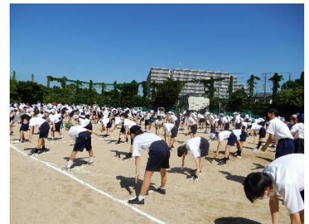
曇一つない空のもと準備体操をしました

1家庭1名の参観の制限の中、足を運んでいただいた保護者の方々には感謝申し上げます。また、早朝より放送による音量などで地域の方々にも大変ご迷惑をおかけしました。ご協力ありがとうございました。