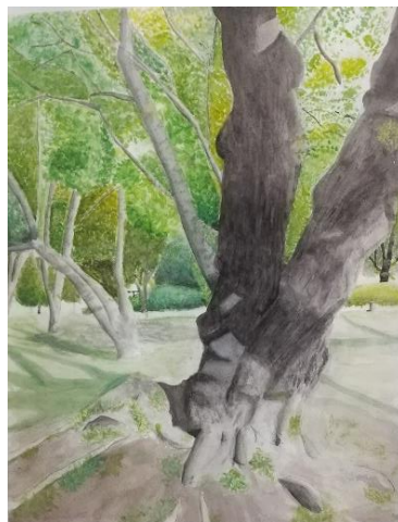
推奨 1年 作品名「春の木漏れ日」