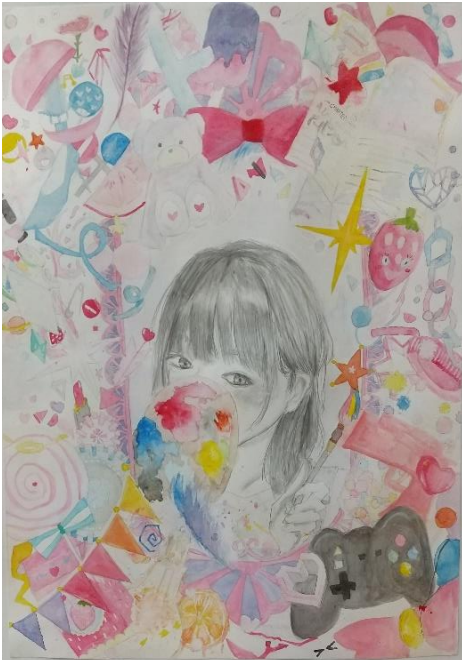
教育長賞 3年 自画像 作品名「自分で色づけるもの」