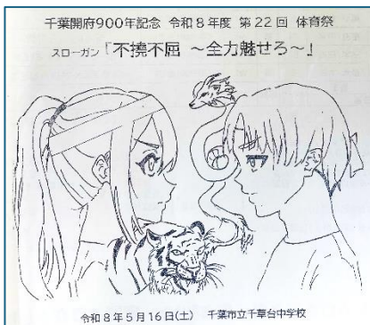
プログラム表紙絵 生徒作成

「強い意志をもって、どんな困難にも立ち向かい、決して心折れることなく、最後まであきらめずに走り切る。その姿をみんなに見てもらいたい。」という思いを込め、体育祭実行委員会がこのスローガンを決めてくれました。また、写真のスローガンボードを制作してくれた美術部の皆さん、ありがとうございました。