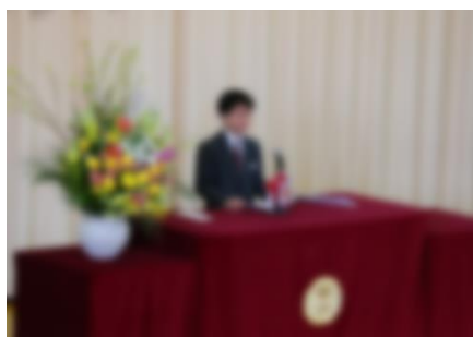
在校生代表「歓迎の言葉」