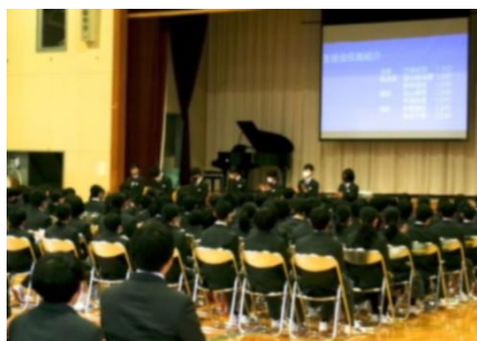
生徒会本部役員紹介

4月9日（火）午後、対面式を行いました。生徒会活動や委員会活動の紹介を、生徒会本部や専門委員長が中心となって作成したスライドで1年生にもわかりやすく説明を行いました。部活動紹介では、各部活動で工夫を凝らした発表を行い、1年生を歓迎する和やかな式となりました。