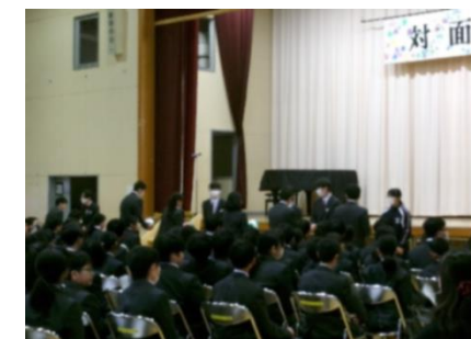
新入生へボールのプレゼント