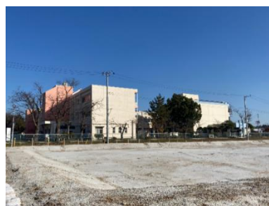
旧南小側からの撮影です(風が強くなった?)