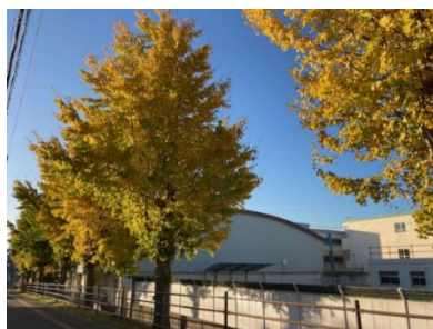
タウンライナーズ通りの紅葉は見事でした。