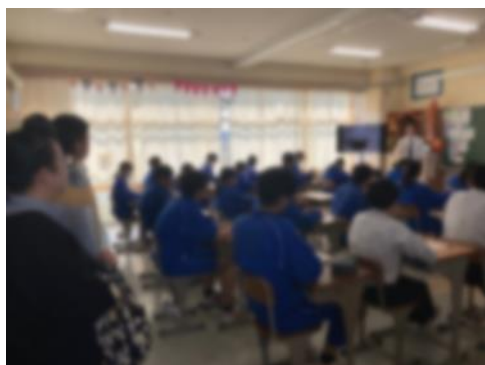
地雷の写真から考えを深めました

同日午後に授業参観、自然教室説明会、進路説明会を実施しました。ご多用のところ来校いただきまして、誠にありがとうございました。お子様の様子はいかがでしたでしょうか？