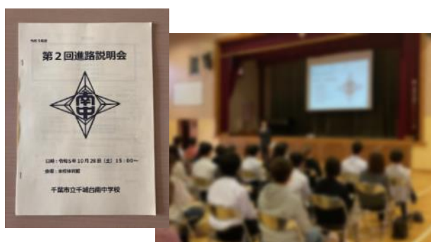
学年主任の挨拶のあと進学担当が説明