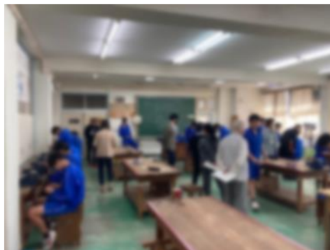
金属加工でキーホルダー製作