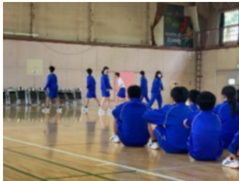
グループ単位でのダンス発表