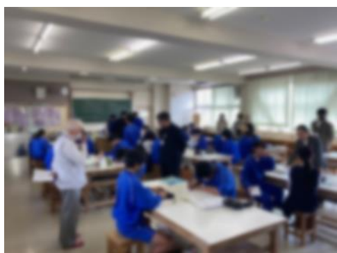
幼児教育として絵本づくり