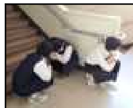
階段での避難行動