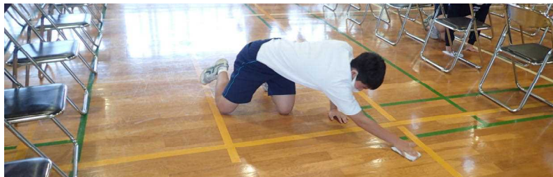
黙々と入学式会場の雑巾がけに励む3年生。床を磨くことで心もピカピカに！

実際、この合い言葉は、生徒の皆さんの中にもかなり定着していることを、その生活ぶりから感じることができました。毎朝の登校時には、ほとんどの生徒が右側通行を守っています。本校前の道は歩道もあまり整備されていない上に交通量も多く、安全面が危惧されています。そのような中で、しっかりと交通ルールを守り、自分の身を守る姿勢は大切です。また、今年度の入学式は、新型コロナウイルスの感染拡大防止のため、上級生の参加はできませんでした。しかし、会場準備や片付けなど多くの場面で上級生が黙々と活動する姿が見られました。その姿からは、先輩として新しい後輩への心からの思いが伝わるものでした。これらの上級生の行動は、1年生もしっかり見ています。このようにつながりが、伝統になっていくのだと思います。