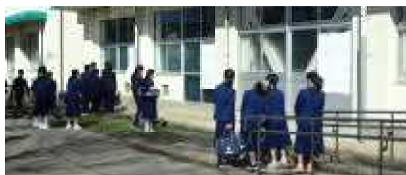
間隔を開けて掲示した学級発表

教室に入った生徒たちからは、緊張した面持ちの中、「やっと中学校に来ることができた」という安心感や、「これからがんばるぞ」という意欲を感じる事ができました。