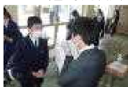
2年生…個別に新学級の発表