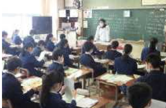
3年生…また会えたね。今年もがんばろう。心は一つ!