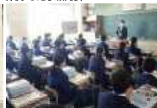
「中学校って大変そう。でも楽しそう」

校報「若松中だより 第2号」をお届けします。本校では、ご意見やご感想を広く募集しております。お気づきの点等ございましたら、下記までご連絡ください。