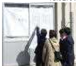
「やったー 同じクラス?」