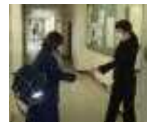
手指を消毒して校内へ