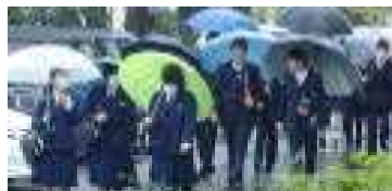
久しぶりの登校「元気だったあ!？」

例年とは少し違う形でのスタートになりましたが、例年通りの落ち着いた雰囲気の中、最初の登校日を終わることができました。