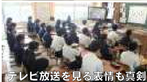
テレビ放送を見る表情も真剣