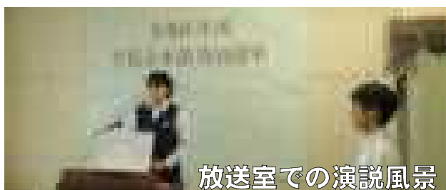
放送室での演説風景