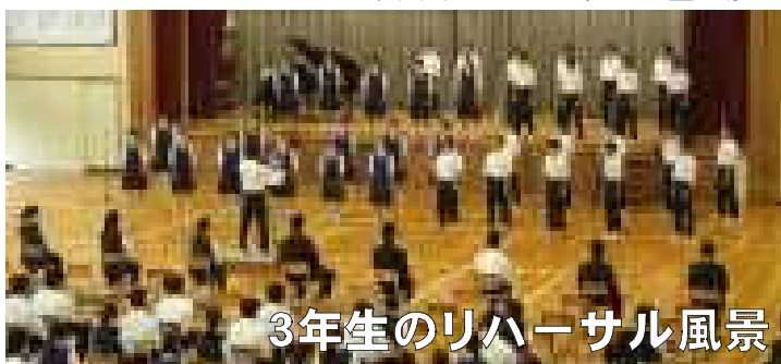
3年生のリハーサル風景

本日は、各クラスの自由曲と指揮者・伴奏者、演奏前にクラスのこれまでの取組や意気込みをコメントするクラス紹介者を紹介します。