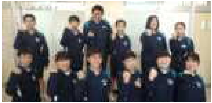
学年をリードしてくれた、実行委員の皆さん