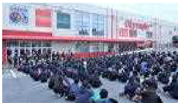
オリンピック千葉桜木店様の駐車場をお借りした出発式

また、昨年までは、本校正門前にお借りしていた駐車場があったため、校外学習や自然教室時のバスの発着はそこで行っていました。今年はその駐車場もなくなり、傾斜や戸口幅の関係でグラウンドにもバスを入れることができなくなってしまいました。学校前の路上にバス5～6台を駐めた場合には、近隣の皆様に多大なるご迷惑をおかけすることになってしまいました。そこで、オリンピック千葉桜木店様に相談させていただいたところ、快く、駐車場を貸していただくことができました。帰校時には、千葉県家畜商協同組合千葉家畜市場様にもご協力をいただいて駐車場を使