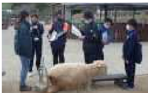
飼育員さんからの聞き取り調査活動

用させていただき、若松台小・若松小付近から登校している生徒を段階的に下車させる配慮をすることもできました。ご協力をいただいた両施設の方には、この場をおかりして厚く御礼を申し上げます。ありがとうございました。