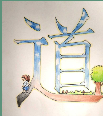
デザイン（平面）絵文字 さん（1-2）

休み時間に鑑賞している生徒も多いです。ぜひ、次回の作品作りに活かしてほしいです。