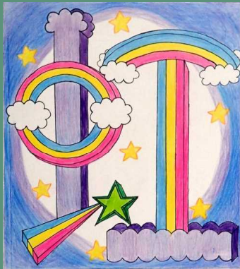
デザイン（平面）絵文字 さん（1-3）