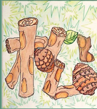
デザイン（平面）絵文字 さん（1-3）