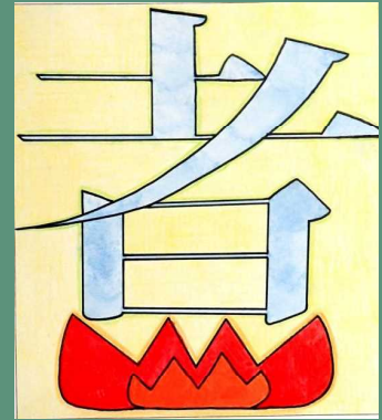
デザイン（平面）絵文字 さん（1-2）