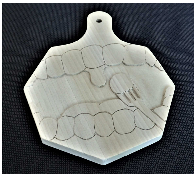
工芸(立体)なべしき _____くん(2-2)