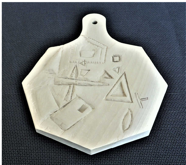
工芸(立体)なべしき _____くん(2-1)