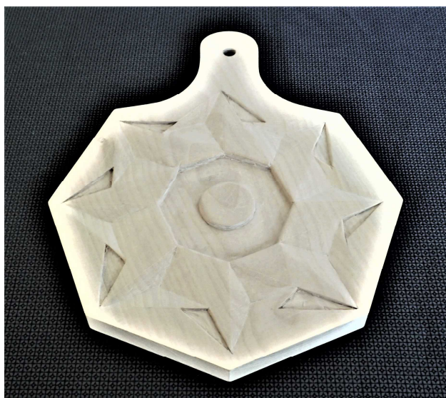
工芸(立体)なべしき _____くん(2-1)