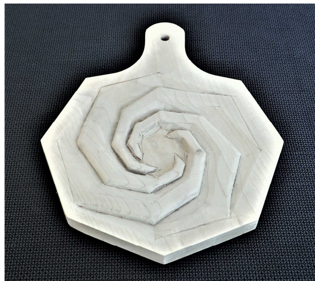
工芸(立体)なべしき _____くん(2-1)