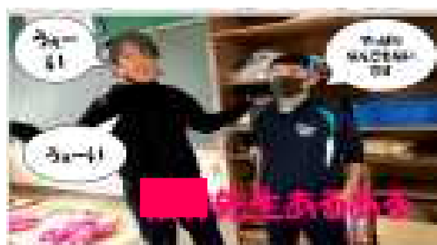
上の6枚も、当日発表されたものを更に編集して作成したイメージです。実際の発表内容とは若干、異なります。

最後に、生徒会本部役員が3年間の主な行事を、実際の3年生の写真をつなげたスライドショーで振り返ってくれました。特に、入学当時の初々しい3年生の姿が紹介された際には、4階の3年生の教室すべてから喜びの奇声があがっていました。1・2年生にとっても、「今の立派な3年生にも、こんなカワイイ時期があったんだなあ」と感じる事ができた貴重な瞬間でした。