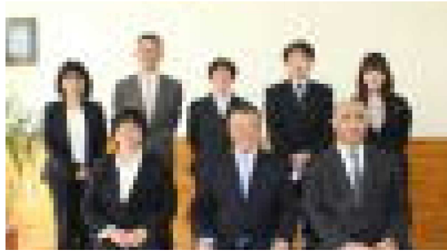
後列… __、__、__、__、__ 前列… __、__、__