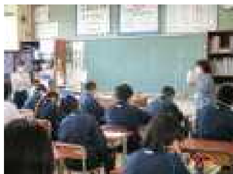
チームティーチングで説明した講座