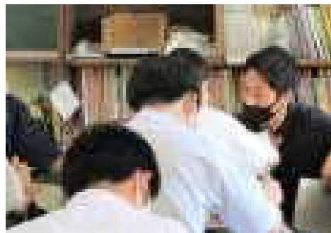
講座での個別支援