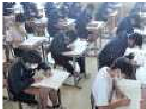
真剣にテストに臨む3年生

次回の定期テストは9月2日（木）3日（金）です。9教科で実施します。まだまだ先のことに思うかもしれませんが、夏休みがあるため、授業が進むのは1ヶ月分です。新しい学習内容のテスト範囲が少ないため、今回の定期テストの範囲と一部重ねて出題します。今回の定期テストとほとんど同じ問題が出る可能性もあります。ぜひ、しっかりと復習をしておきましょう。