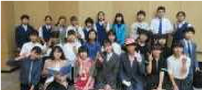
演劇部 夏季発表会優良賞・舞台効果賞・舞台美術賞 音響効果賞・舞台小道具賞