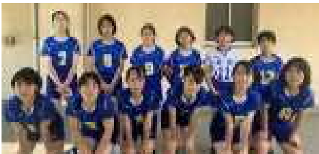
バレーボール部 市ベスト16