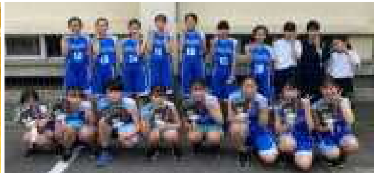
バスケットボール部女子 初戦惜敗