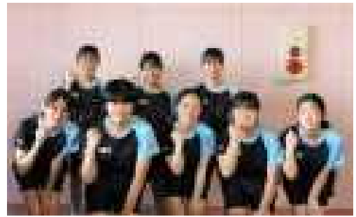
卓球部女子 市ベスト8