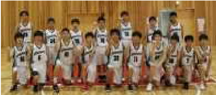
バスケットボール部男子 市ベスト8