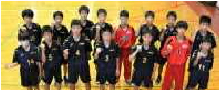
ハンドボール部男子 市優勝 県優勝 関東大会出場