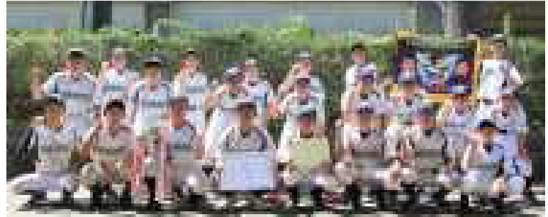
野球部 ブロック優勝 県大会出場