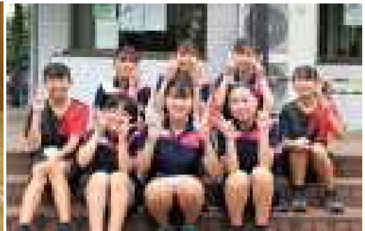
ソフトテニス部 市ベスト16