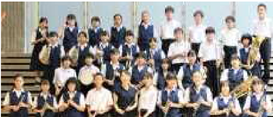
吹奏楽部 県吹奏楽コンクール銅賞