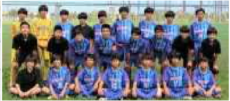
サッカー部 ブロック準優勝