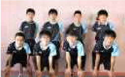
卓球部男子 市準優勝 県ベスト16