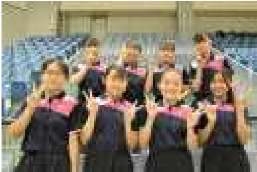
バドミントン部 市ベスト32

昨年は開催されることのなかった総体やコンクール…。参加できることに感謝しながら、最後まで全力を尽くそうとしていた姿が印象的でした。主な結果をお知らせいたします。