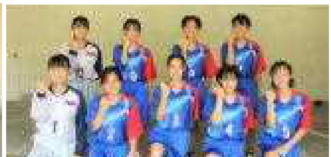
ハンドボール部女子 市準優勝 県3位