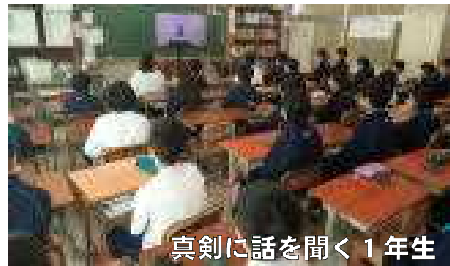
真剣に話を聞く1年生