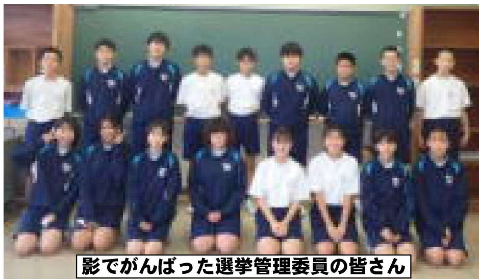
影でがんばった選挙管理委員の皆さん

選挙管理委員長を務めてくれた、_____さん (3-2) に感想を聞いてみました。