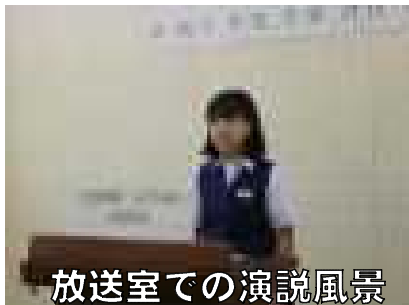
放送室での演説風景