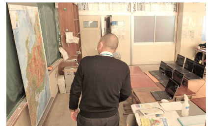
オンライン授業の発信風景

学年閉鎖中は、復習を中心に、オンラインでの学習を進めています。6台のギガタブを並べて全クラスに同じ授業を同時に配信するという形をとりました。黒板の内容等が画面を通すと意外と見にくかったり、貸し出し用のWi-Fiの容量が少なかったり、課題も見えてきましたので、今後、改善を進めていきたいと思っております。