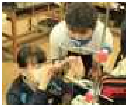
最近の理科の授業の一場面より