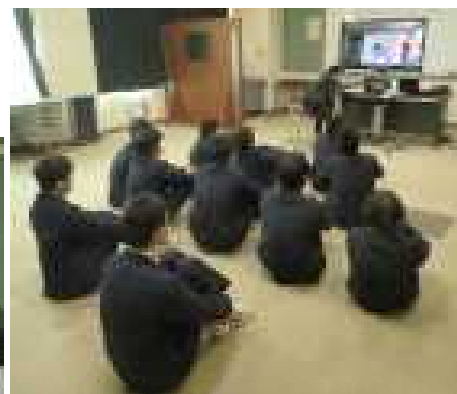
他校の発表の参観風景

行事後の振り返りシートの中から、感想を紹介します。やはり行事を通して得た経験からは、多くのことを学ぶことができ