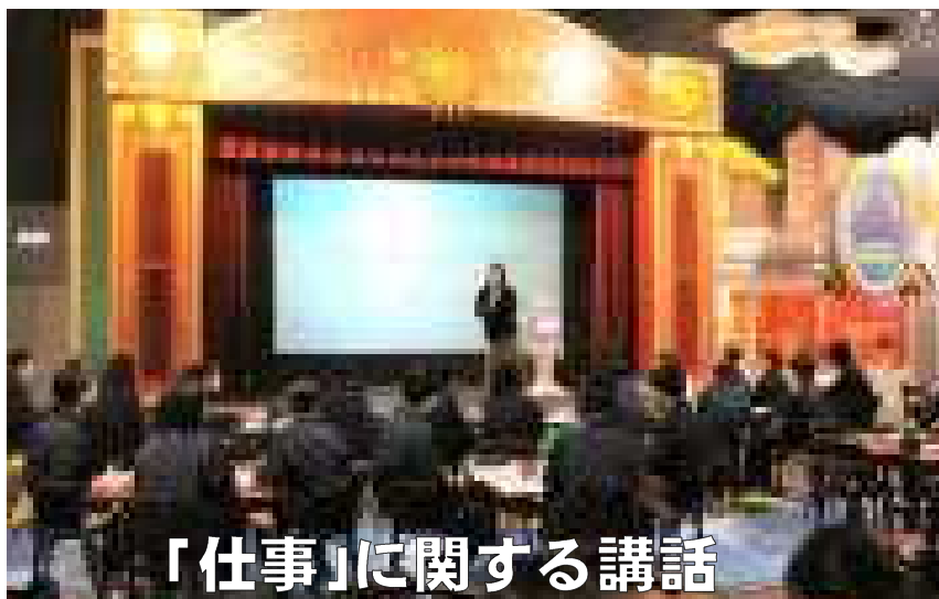
「仕事」に関する講話

「皆楽協締～みんなで楽しく協力して、良い締めくくりをしよう～」というスローガンのもとで取り組みて来た今回の校外学習。速報として、その活動の様子をお知らせします。