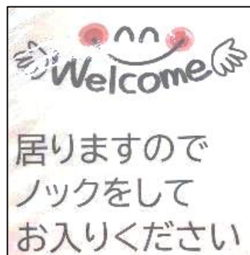
校長室入口に下げているカード

校長である私のもとにも、多くの生徒が相談にやってきました。もちろん、内容は多様です。わずかな時間でしたが、少しでも自分の思いを伝えられたのならうれしいです。教育相談といいますが、その中で多くのことをお話しできました。私はその生徒さん自身をさらに知ることができました。たとえば「□□さんは◇◇なことをされているのですね」「なんて○○さんは素敵なのだろう」「実は☆☆が得意だったのね」ということも。このことは、相談者の思いを聞きつつも、その人の素敵な一面を垣間見ることができる教育相談の大きな効果の一つと考えています。悩みもあるけれど、自分自身って素敵な存在なのだよと伝えるものです。