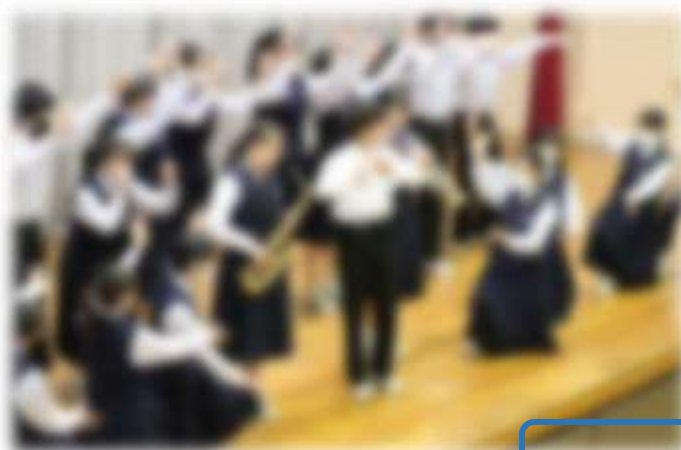
部活動の紹介の様子