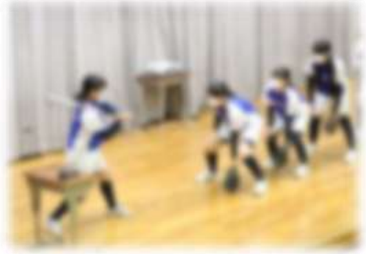
部活動の紹介の様子