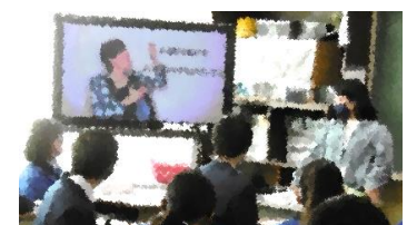
〈手話体験レクチャー〉