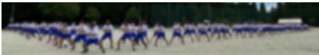
特別企画越智中ハカ