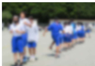
盛り上がった学級対抗長縄跳び