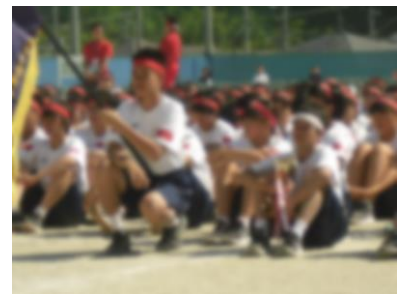
競技の部優勝紅組 応援賞白組

今年も体育祭を実施するにあたって、「みなみ会」や「おやじの会」の方々が、警備や敷地内のパトロール活動等をしてくださいました。ご尽力いただきまして、誠にありがとうございました。