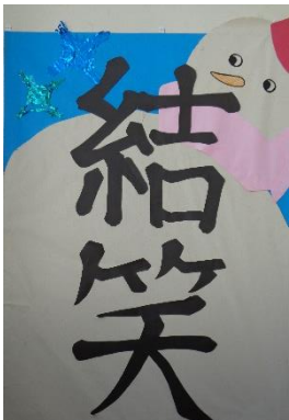
【3年生年間スローガン】