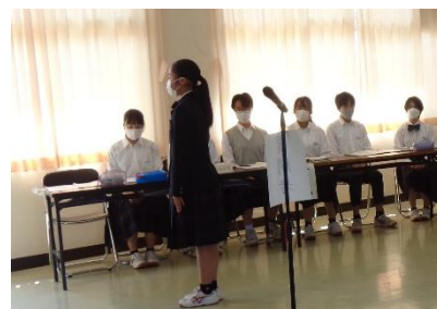
画面越しに向かってしっかり伝えています

温かい雰囲気を大切にし、和やかな関係を築き、学校全体の笑顔に向かって臨んでいきたいという思いが込められています。