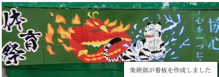
美術部が看板を作成しました

5月13日（土）磯辺中学校第11回体育祭が行われました。実行委員会を中心に進められた開会式から応援合戦、学級対抗長縄跳び、ムカデ競争、ジャベリック投げまで終了した段階で雨が降り始め、中断となりました。