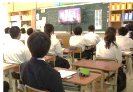
オンラインでも真剣に参加しています