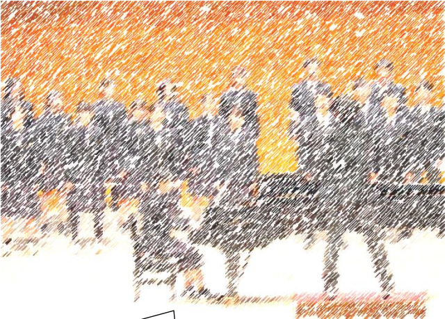
最優秀賞 3 年 D 組