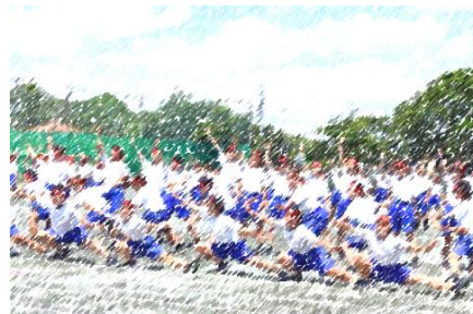
全校生徒による花見川中ソーラン