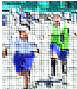
見事なバトンパス (左: 5組、右: 1年2組)