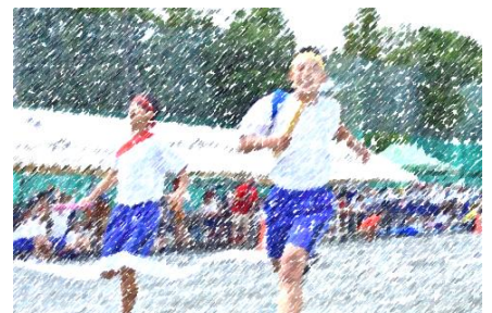
Final Run (色別対抗リレー)