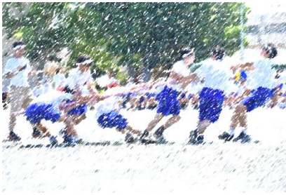
3年男子による棒引き