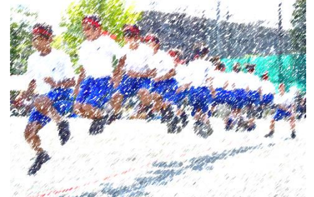
長縄で最高記録を出した2年1組