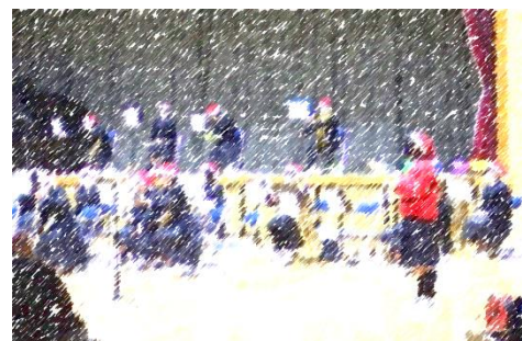
吹奏楽部 クリスマスコンサートを行いました