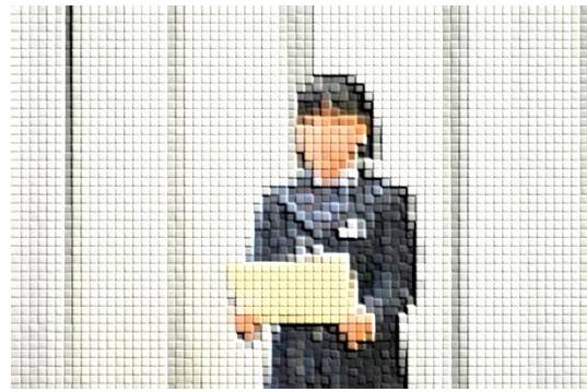
弁論大会発表 「忘れてはいけない日」

その後11月2日弁論大会にて最優秀賞受賞 他を圧倒する表現力で、涙ぐむ観客も いました。