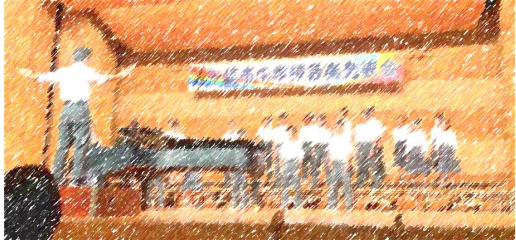
10月26日(木)千葉市音楽発表会に参加した3年3組