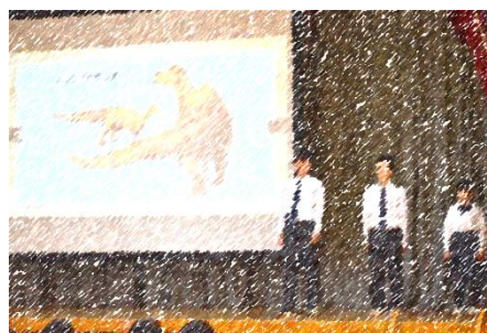
図書委員によるブックトーク