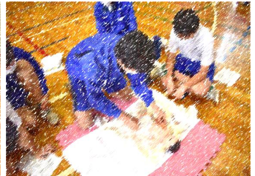
沐浴人形にて、おむつ交換体験