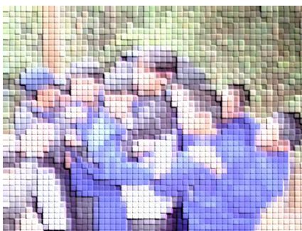
赤城アドベンチャープログラム