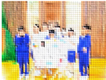
スローガンの制作を担当

千葉県長生郡長柄町にある千葉市少年自然の家において、1泊2日でげんきキャンプが実施されました。5組8名が参加しました。他校の生徒との交流は、大きな成長につながったことと思います。