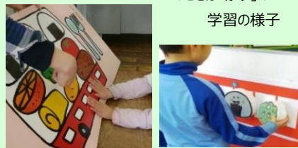
「ことば・かず」の 学習の様子