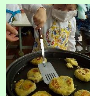
「いもちを作ろう」 の学習の様子