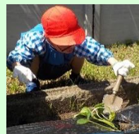
「さつまいもを植えよう」