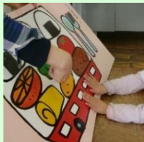
「ことば・かず」の 学習の様子