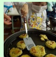
「いもちを作ろう」 の学習の様子