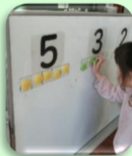
「ことば・かず」の学習の様子