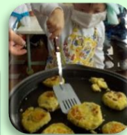
「いもちを作ろう」 学習の様子