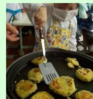
「いもちを作ろう」 の学習の様子