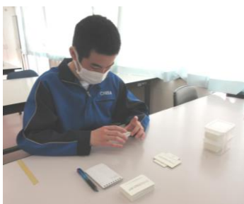
1枚1枚 真剣に点検しています