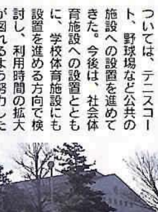
千葉公園体育館とプール

Q 市民のスポーツ・レクリエーションを普及させるため、スポーツ施設の利用時間については、拡大していくことが望まれている。そこで、夜間利用に対応するため、野外施設の夜間照明の増設計画やシャワー設備などの整備計画について伺う。 A また、老朽化の進んでいる千葉公園体育館と千葉公園プールの建て替えを早急に実施すべきと思うが、具体的なスケジュールを伺う。