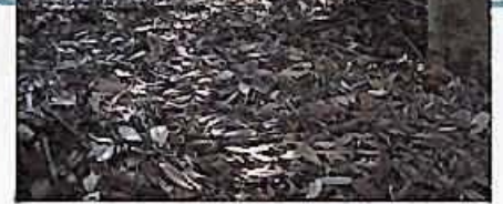
活用が望まれる公園樹の落ち葉

Q 市民の日に関する行事の展開と、学校の休日化について、見解を伺う。また、制定については、条例の制定を考えているのか、併せて伺う。 A 基本的な行事として、毎年、記念式典を実施し、市政功労者の表彰や交歓会を開催するほか、区民祭りなどを市民の日の前後に開催したい。