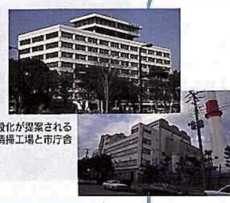
複合施設化が図られる清掃工場と市庁舎

Q 清掃工場建て替え問題について、幕張C地区の用地取得が微妙になっている状況の中で、市独自に第3の候補地を示し、原案に立つて最善地を検討する必要があるのではないかと、現時点における見解を伺う。また、新清掃工場をエネルギー供給施設と位置づけ、市役所の建て替えとあわせて市役所敷地内に複合施設として設置してはどうか、見解を伺う。 A 用地を早急に決定しなければならぬという状況の中で、ひとつの方法は、先ずは、現在の候補地について、県と幅広く協議してエネルギーを有効活用すること、21世紀の清掃工場のあり方として進むべき方向であると考えており、市役所との複合施設は新しい発想の提案として理解させていきたい。