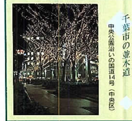
千葉市の並木道 中央公園沿いの国道14号(中央区)

編集 「おめでとうございませう。」と言っていました。早いもので今日からは2月。これからますます寒くなり、春はまだまだ遠い感があります。 市民の皆様にはお体をご自愛いただき、お健やかに過ごしていただきたいと思います。