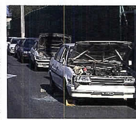
さまざまな障害のもとになる放置自動車(美浜区)

都市下水委員会 (所管)都市局、下水道局) 一般会計補正予算、千葉市都市計画土地地区画整理事業特別会計補正予