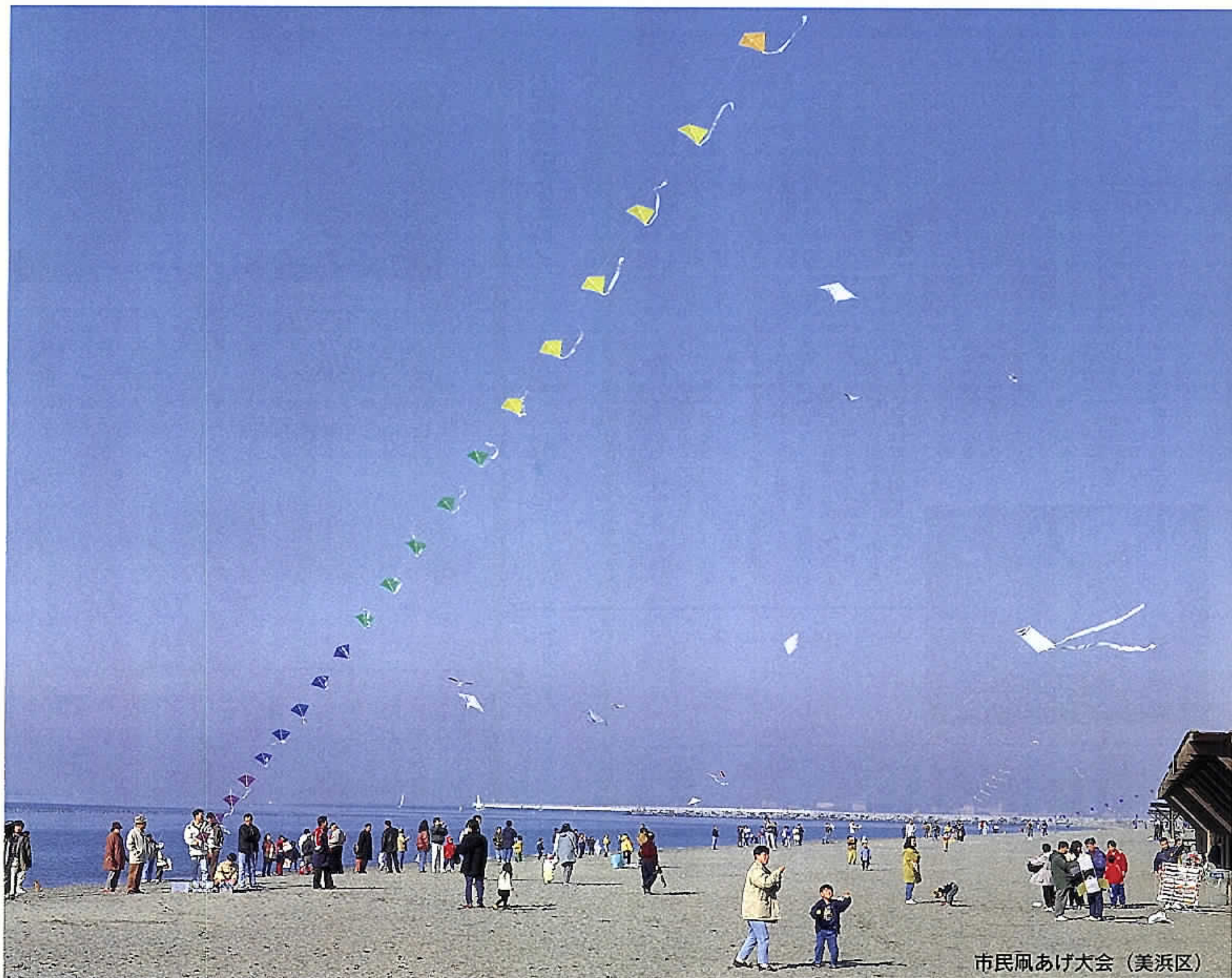
市民風あげ大会 (美浜区)