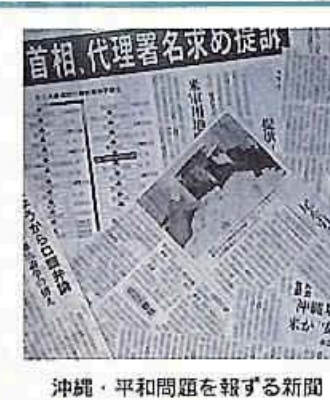
沖縄・平和問題を報ずる新聞

Q 沖縄での米兵による少女暴行事件を契機とした日米地位協定の早期見直し、基地の整理・縮小の促進および首相の代理署名などに対する見直し、たひ重なるフランスの核実験についての市長の認識、対応を伺う。 A 沖縄問題については、我が国の平和と安全保障にかかわる極めて重要な問題であり、国政の場において各種の論議がなされているので、その動向を注視していきたい。