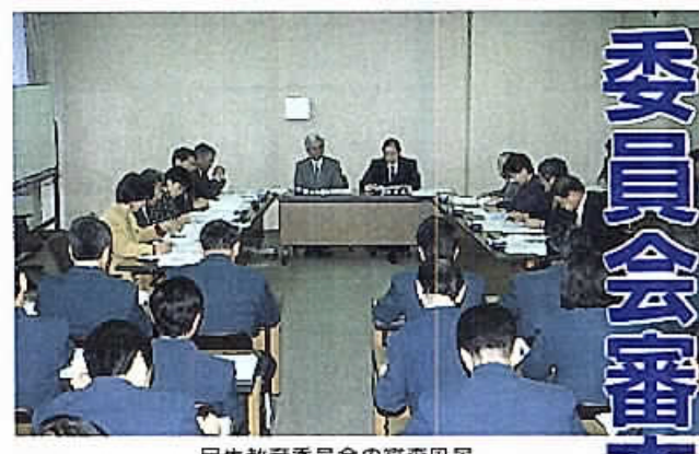
民生教育委員会の審査風景

常任委員会 12月5日に開かれ、議案17件、請願8件、陳情3件を審査しました。その結果、全議案を可決し、請願・陳情は、採択送付1件、不採択3件、継続審査7件となりました。