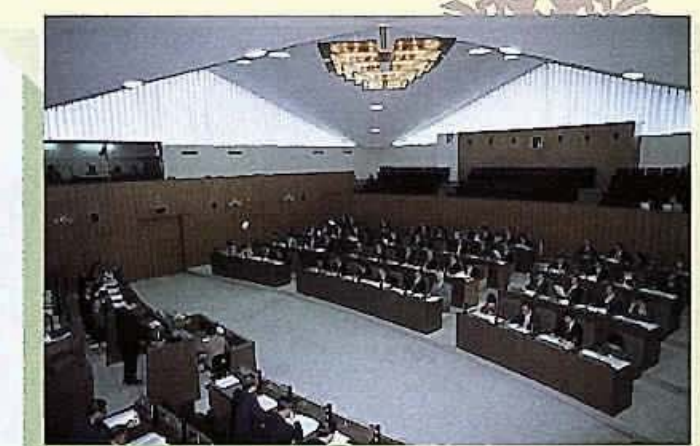
12月7日(市民自由クラブ・市政会)、8日(民主新政クラブ・日本共産党千葉市議会議員団・千葉市議会公明)、11日(市民クラブ・市民ネットワーク)の3日間にわたり、7会派の代表から市政運営などについて質問が行われました。