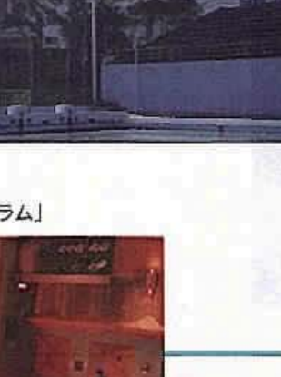
市民参加の「街づくり市民フォーラム」