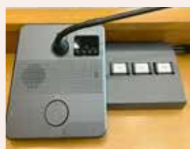
賛成または反対のボタンを押して表決します。