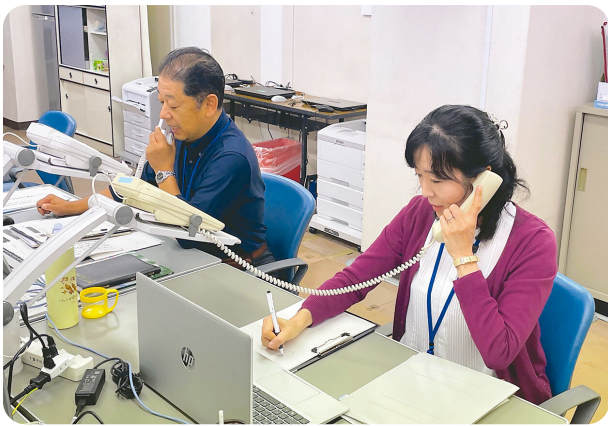
福祉まるごとサポートセンターにおける電話相談

ダブルケア、ヤングケアラー問題などや制度の狭間にある課題を抱えた方の相談を包括的に受け付ける「福祉まるごとサポートセンター」を10月に開設するなど、相談体制の強化などに努める。