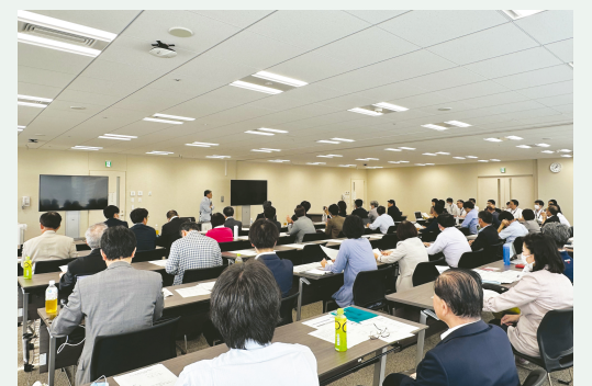
有識者を招いての講演会