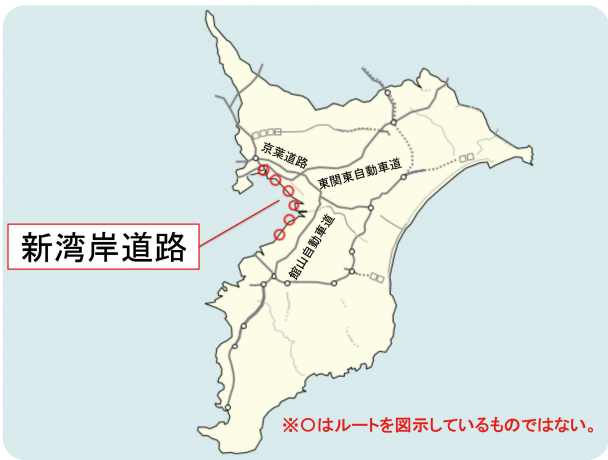
※〇はルートを図示しているものではない。

子どもに対しては、発達段階に応じ、生命を大切にすることを身に付ける取り組みを進めている。教職員に対しては、これまでの研修に加え、今年度から職務の階層に応じて、外部有識者などによる研修を開始し、根絶に向けた教育・啓発を行っている。