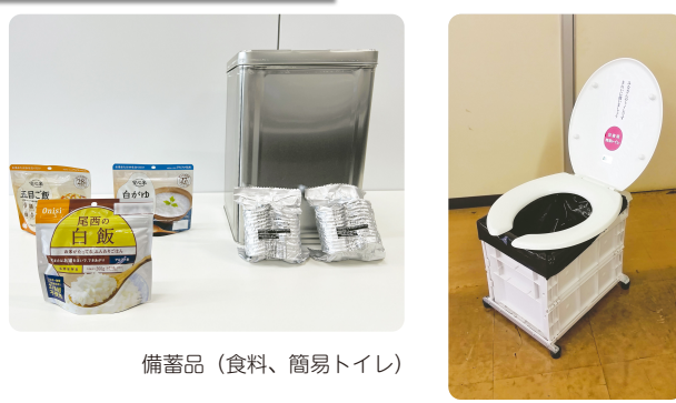
備蓄品(食料、簡易トイレ)

マグニチュード7.3の本市直下地震、避難所避難者数18万2,530人を想定し、発災から3日分を備蓄している。市民の皆様には、最低3日分、できれば1週間分程度を備蓄いただきたい。