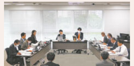
委員会中継のイメージ画像

常任委員会では、それぞれ担当の委員会に付託された議案や請願などを詳細に審査し、委員会としての可否を決める様子をご覧いただくことができます。また、調査特別委員会では、特定の問題(大都市制度、防災・減災対策)を調査する様子をご覧いただけます。