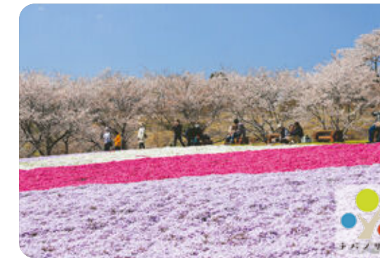
富田さとにわ耕園

答 エリア内資源の観光マップへの記載等による周遊促進や、民間事業者と連携した新たな観光資源の開発等に取り組む。また、訪日外国人向けに、四季折々の見どころを海外へ発信していく。