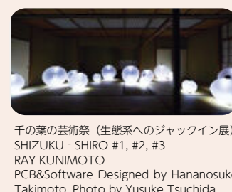
千の葉の芸術祭(生懸系へのジャックワイン展) SHIZUKU・SHIRO #1, #2, #3 RAY KUNIMOTO PCB&Software Designed by Hananosuke Takimoto

答 近隣住民のスタッフとしての参加や被写体としての児童生徒の写真作品への参加など、市民の皆様が参加・体験しやすい芸術祭とすることができた。また、公共施設の新たな活用方法の提示や、市にゆかりのあるアーティストに参加いただき、文化芸術の取り組み・人材の魅力を発信できた。今回は美術館の展覧会の年間入場者数に匹敵する約15万人以上の来場者数を目標としていきたい。