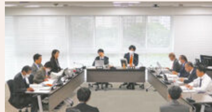
委員会中継のイメージ画像

常任委員会では、それぞれ担当の委員会に付託された議案や請願などを詳細に審査し、委員会としての可否を決める様子をご覧いただくことができます。また、調査特別委員会では、特定の問題(大都市制度、防災・減災対策)を調査する様子をご覧いただけます。