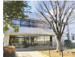
動物保護指導センター

答 令和7年度以降に予定している基本設計や実施設計といった作業を経て、整備費と具体的なスケジュールが明らかになると思われる。一般的な施設整備の工程などを踏まえると、基本設計及び実施設計にそれぞれ1年ずつ、建築工事に2年間程度を要すると想定している。