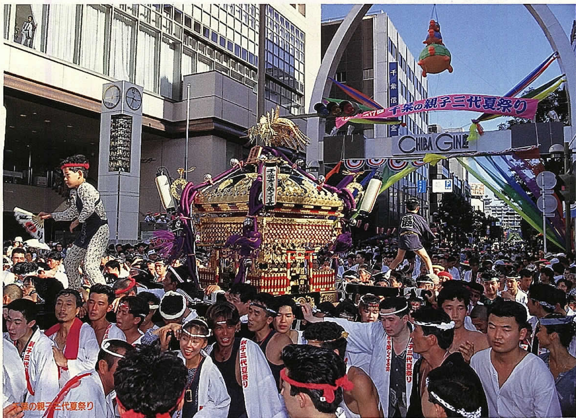
千葉の親子三代夏祭り

発行/千葉市議会 編集/千葉市議会事務局 〒260-91 千葉市中央区千葉港1-1 ☎043(245)5111(代)